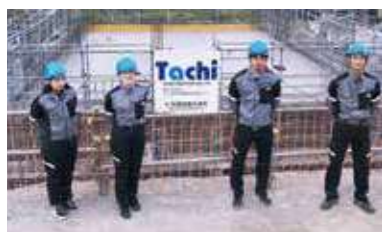
5月から新しくなったユニフォーム