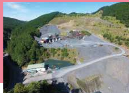
甲賀市の砕石プラント「信楽工場」