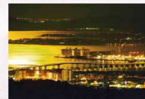
「月明の琵琶湖大橋」 平 尚治〔滋賀県〕〔滋賀県大津市〕