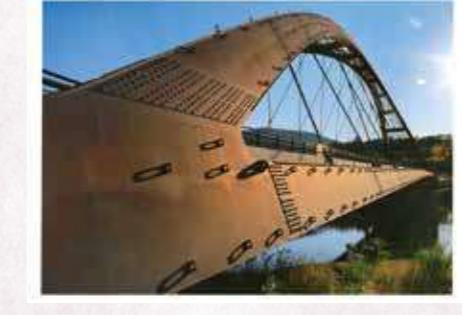
「夕映えの瀬田川 令和大桥」 木下 正治 〔京都府〕〔滋賀県大津市〕