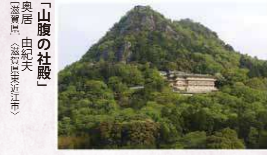
「山腹の社殿」 奥居 由紀夫 〔滋賀県〕〔滋賀県東近江市〕