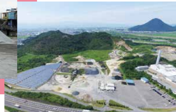
栗東市内にある砕石プラント「丸塚工場」