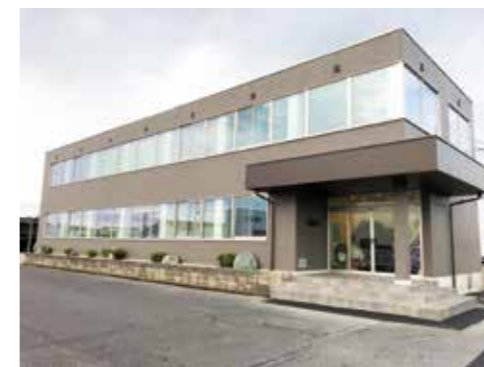
8月末に全面改装を終えた社屋