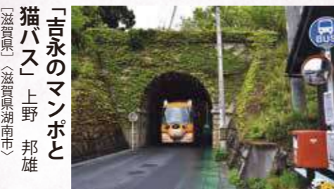
「吉永のマンポと猫バス」 上野 邦雄 〔滋賀県〕〔滋賀県湖南市〕