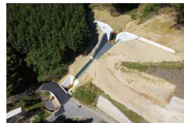
施工例：金勝川補助通常砂防（総流防）工事 令和2年滋賀県優良工事 優秀賞