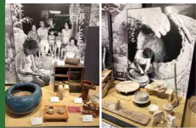
昭和30~40年代の隆盛期の生産シーンなどがジオラマ展示されている。