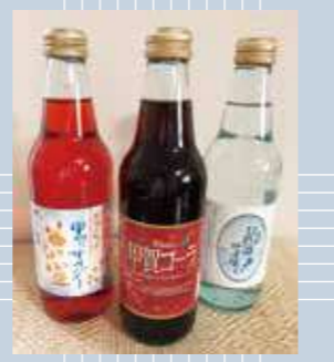
いずれも1本(340ml) 238円(税込み)

忍者装束を連想させるコーラそっくりの黒いサイダーで、コーラの主成分と同じカラメルやカフェインを加えることで、コーラの飲みごたえを再現、それでいて後味はスッキリ爽やかで飲みやすいのが特徴です。 さらに、昨年からNHKの朝の連続テレビ小説『スカーレット』にちなんだ、鮮やかな緋色の『スカーレット甲賀サイダー』も新たにご当地ドリンクに加わりました。 『甲賀コーラ』は滋賀酒造の敷地内にあるショップ『びわこいみち』や、県内の道の駅やSAなどでも販売されているほか、滋賀酒造のネットショップなどでも購入できます。隣の伊賀市には『忍ジャーエール』というご当地ドリンクがあり、甲賀・伊賀の飲み比べを楽しんでみるのもおもしろいかもしれません。