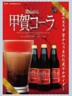
ラベルに忍者と手裏剣をあしらった黒いサイダー『甲賀コーラ』