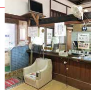
レトロな雰囲気のある容輝湯の脱衣場