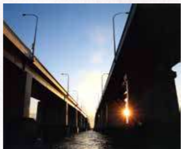
「弘暁の琵琶湖大橋」 塩見 芳隆〔京都府〕〔滋賀県大津市〕