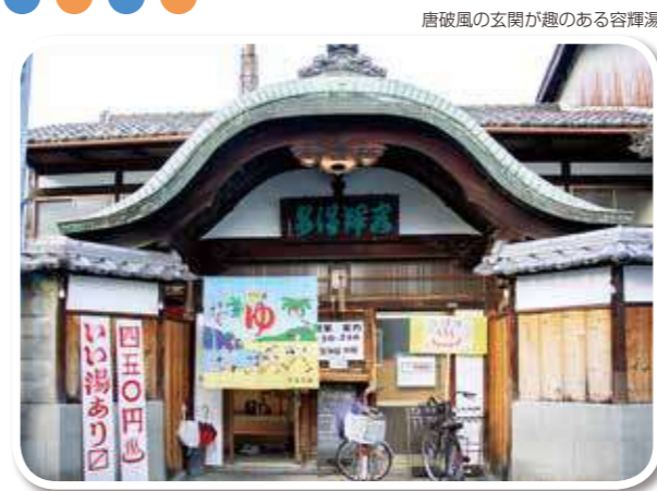
唐破風の玄関が趣のある容輝湯

容輝湯 ●大津市栄町17-10 ●080-3783-1126 ●15:00~24:00 (現在は感染対策のため23:00まで) ●定休日:火曜日 ● https://twitter.com/youkiyu_1126