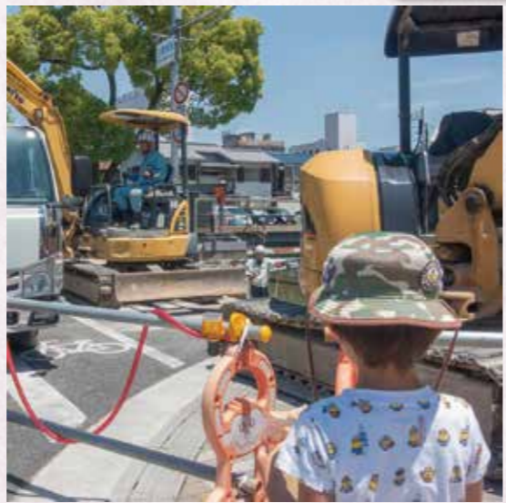
夢けんせつフォトコン実行委員会 委員長賞 0615wish 「ボクの憧れの職業」