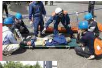
毎年9月に 全社をあげて 行われる 防災訓練