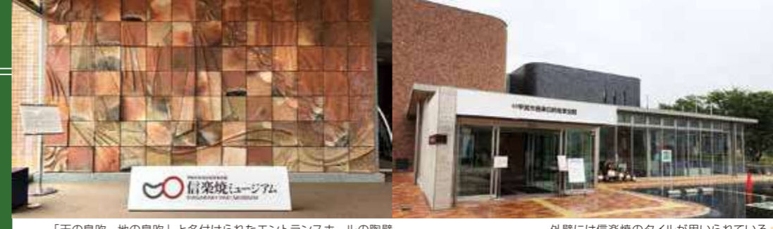
「天の息吹、地の息吹」と名付けられたエントランスホールの陶壁 外壁には信楽焼のタイルが用いられている。