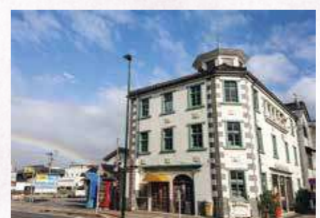
「明治を思う」 辻 辰雄〔滋賀県〕〔滋賀県長浜市〕