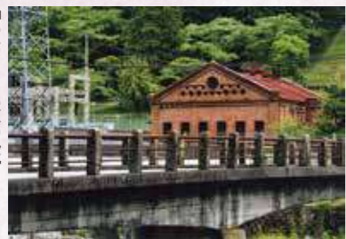
「大戸川変電所」 島 秀紀 〔滋賀県〕〔滋賀県大津市〕