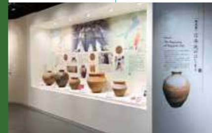
信楽焼の生い立ちについて紹介するコーナー