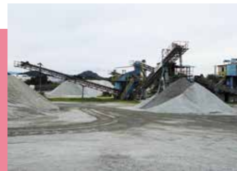
丸塚工場の中にある産業廃棄物処理施設