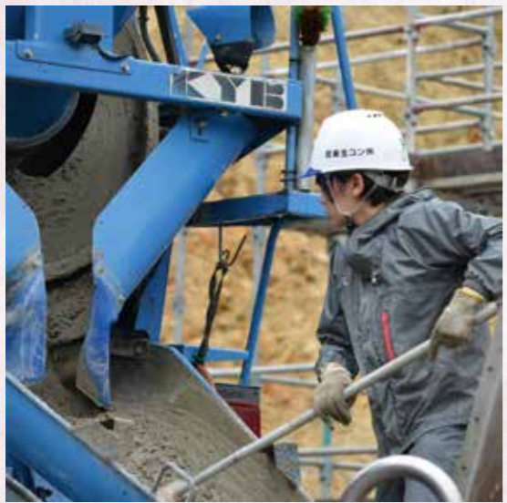
夢けんせつフォトコン実行委員会 委員長賞 masamiiii.run 「女性も建設現場で頑張ってます！」