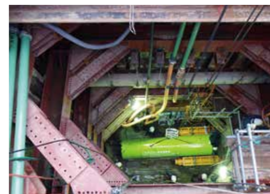
施工例：西部幹線下流9工区送水管工事 平成29年滋賀県優良工事 滋賀県知事表彰