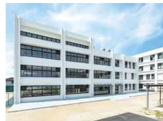
施工例：守山南中学校舎増改築建築工事