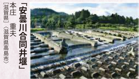
「安曇川合同井堰」 本庄 重夫 〔滋賀県〕〔滋賀県高島市〕