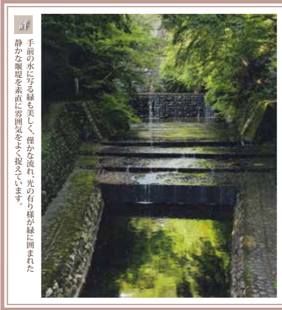
「新緑に包まれて」 鈴村 栄子〔滋賀県〕〔滋賀県東近江市〕