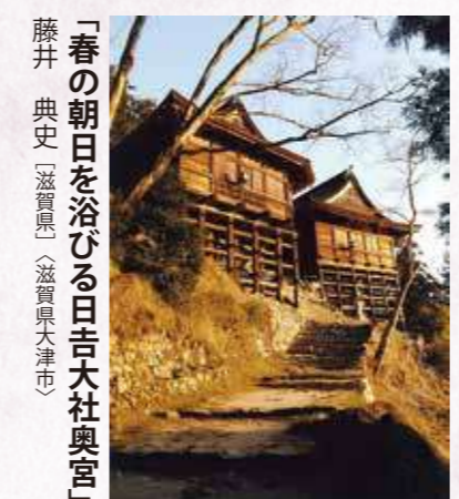
「春の朝日を浴びる日吉大社奥宮」 藤井 典史〔滋賀県〕〔滋賀県大津市〕