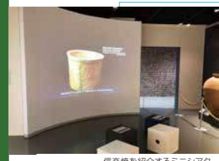
信楽焼を紹介するミニシアター