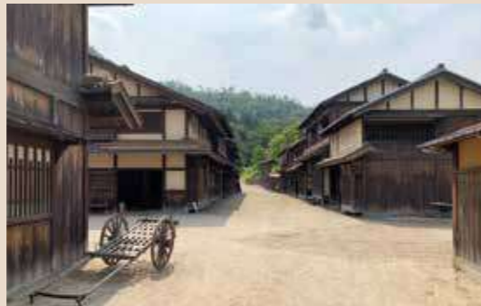
『燃えよ剣』の撮影に 合わせて整備された 時代劇のセット

Shiga movie labo llc 彦根市高宮町2935 https://shiga-movie-labo.com/