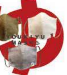
大好評で完売したオリジナルマスク

休業中は、ただ休むだけでなく、何か社会の役に立ちたいとオリジナルマスクと石鹸の香り