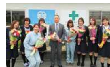
母の日には男女社員に感謝の花束が贈られる。

の確保と育成が不可欠で、女性社員がいきいき活躍できて、すべての社員にとって働きやすい会社にしていくことがポイントになると考えています。同社では、「くるみん認定（子育てサポート企業）」のほか、県の「イクボス宣言企業登録」や「女性活躍推進企業認証二つ星」などを取得しています。