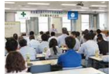
安全協会「ちたばな会」の総会と安全衛生大会

さらに、広報委員会を設置して社内向けの広報誌を発行したり、社員会を組織して旅行やボウリング大会を開催するなど、社員間の交流や親睦を図ってきました。協力会社を集めた安全協会「ちたばな会」でも、年に一度の総会のほか、安全研修や親睦会などを行っています。