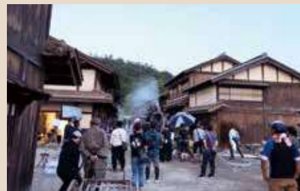
基本的には作品に合わせてセットは造り変えられることになっているが、同じセットで3つの作品が撮影された。

イベントやツアーで集客も ロケ地を新たな地域活性化の資源に 『燃えよ剣』の撮影では約2000人のスタッフが1カ月近く彦根に滞在したこと、宿泊や食事といった地元への経済効果も生まれました。 京都にある太秦映画村のような観光施設ではないため、直接オープンセットに集客することはできませんが、観光による湖東地域の活性化に取り組み『近江ツーリズムボード』などとコラボすることで、撮影地をめぐるツアーやイベントなどに観光客の誘致を図るなど、新たな地域活性化の資源にすることが可能です。 新型コロナウイルスの影響で、多くの映画の撮影が中断を余儀なくされ、彦根のオープンセットでも長らく撮影が行われていませんが、新たな作品の撮影地に選定されることへの期待が高まっています。映画やドラマのロケ誘致を行う『滋賀ロケーションオフィス』や『彦根フィルムコミッション室』などと連携しながら、ロケ地としての魅力を発信していくことが期待されています。 県内の他のロケ地へのアクセスもしやすいことから、オープンセットや市内各所で映画やドラマの撮影が年間を通して行われるようになれば、俳優や監督、スタッフが彦根に滞在して、馴染みのお店ができるようになるかもしれません。映画のまち彦根」として地域が活気づくことに期待が集まっています。