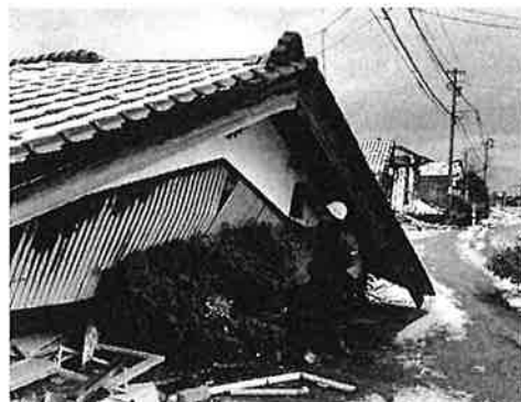
被災した建物の判定活動